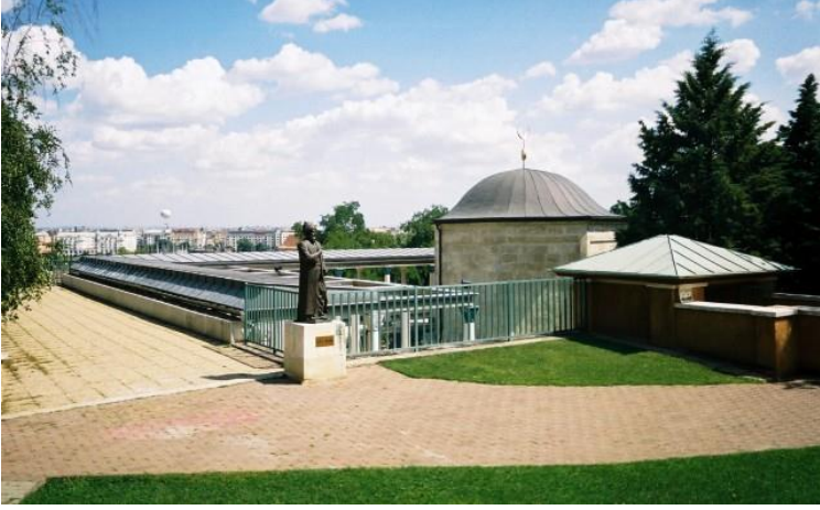
Gül Baba Türbesi / Budapeşte