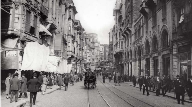
Eski Beyoğlu'ndan bir kare