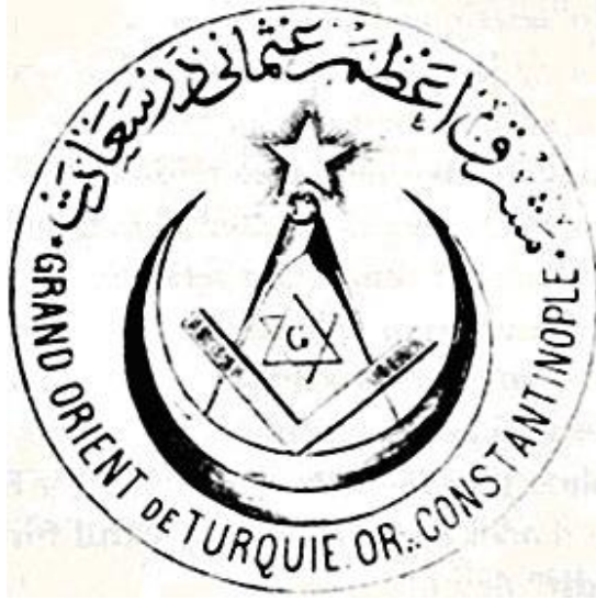
Hür ve Kabul Edilmiş Masonlar Büyük Locası