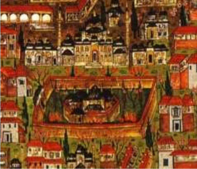
Saray-ı Atik-i Amire'nin Matrakçı Nasuh tarafından çizilen minyatürü.

İstanbul'un fethinden sonra artık Fatih diye anılmaya başlayan II. Mehmet ilk günlerini nerede geçirdiğinin bilgisini ben şahsen bulamadım ama yaptığı ilk işlerden birisinin saray inşaatı için emir vermek olduğu aşikar. Yapılan ilk saray, bugün İstanbul Üniversitesi merkezinin bulunduğu alandıydı. Bu saray hakkında çok bilgimiz yok maalesef. Sadece Matrakçı Nasuh'a ait bir resimde karşımıza çıkıyor bu saray ve yüksek duvarları olan bir bahçe içerisindeki bir çok köşkten oluşan bir yapılar topluluğu olduğu anlaşılıyor. Yapımına 1453 yılında başlanan sarayın inşaatı beş yıl sürüyor ama elbette bu beş yıl içerisinde de bir yandan kullanılmaya devam ediyor.